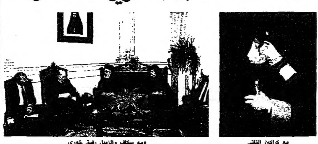
ومع سكاك والزميل رفيق خوري

عصمت دار مطرانية بيروت للروم الارثوذكس قبل ظهر امس بفشخصيات السياسية والروحية التي جاءت لزيارة بطريرك انطاكية وسائر المشرق للروم الارثوذكس اغناطيوس الرابع هزيم، وتنهته بالوصول الى لبنان. ففي الاول الا عشر دقائق استقبل البطريرك هزيم رئيس الحكومة العماد ميشال عون وعرض معه خلال اربعين دقيقة الوضع اللبناني بعد اللقاء قال الرئيس عون: زيارة صاحب الغبطة واجب وقدمت له كل احترام ونحن غبطة على تفاهم دائم. وكان البطريرك هزيم قد التقى صباحا لسفير امريكا في لبنان السيد جون مكاري الذي قال بعد اللقاء: قدمت لصاحب الغبطة احتراميا وتواضعا بالوضع اللبناني ووضع المنطقة وكان غبطة لطيفا بطلاحي على افكاره واتجاهاته عن الوضع، وهو المطالع عن كتب عليه ان يعرف لبنان منذ ٥٧ عاما وهو كان طالبا فيه. سأل عن رأي حكومتكم بعمل اللجنة العربية؟